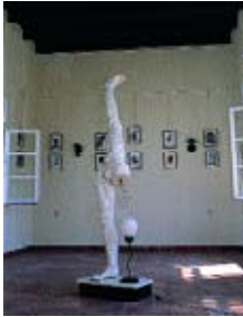
Raum für Ausstellungen. Exhibition space.

Wir vom frappé-magazine sind dieser Einladung gerne gefolgt und haben bei unseren Besuchen im „Kloster des Karolos“ die entspannte und freundliche Atmosphäre sehr genossen; in Karolos einen außergewöhnlichen Menschen und Künstler ken-