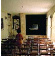
Theater, Kino und Seminarraum. Theatre, cinema and lecture room.

Ich bin gerne bereit, mit jedem neue Ideen und Vorschläge zu diskutieren. Sie können auf jeden Fall immer mit uns reden.“